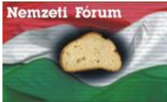
Bács-Kiskun Megyei Szervezete