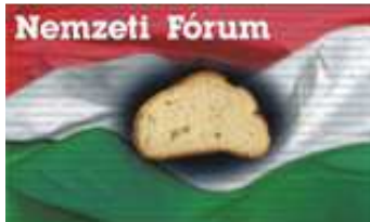
Bács-Kiskun Megyei Szervezete